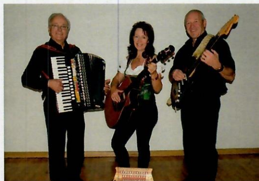
Musik: Granitland Trio